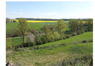
Blick ins Pöppelschetal

Durch scannen des QR-Codes erhalten sie die Karte und eine Wegbeschreibung wahlweise als pdf- oder gpx-Datei zum Download