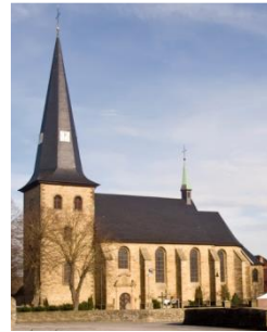
Kirche St. Michael in Berge

Der Weg verbindet die Dörfer Westereiden, Hoinkhausen, Weickede und Berge. Die Täler der Pöppelsche und des Hoinkhauser Baches bieten abwechslungsreiche Perspektiven.