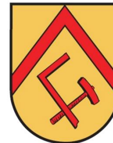
Dorfwappen von Berge